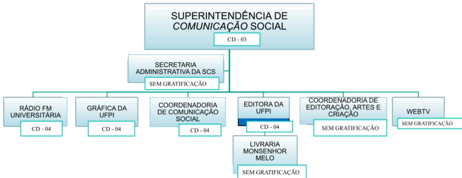
Figura 1 - Organograma11