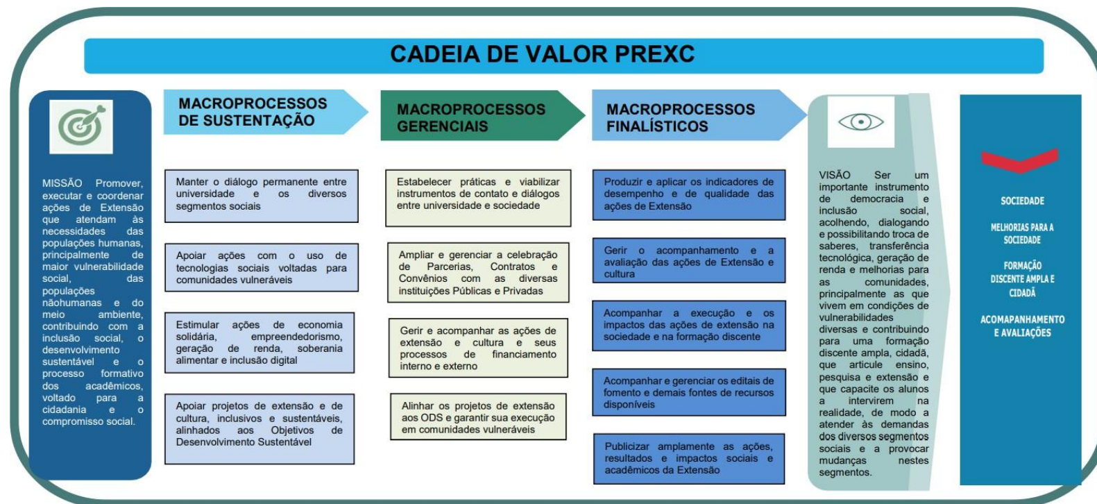
Figura 3: Cadeia de Valor PREXC.