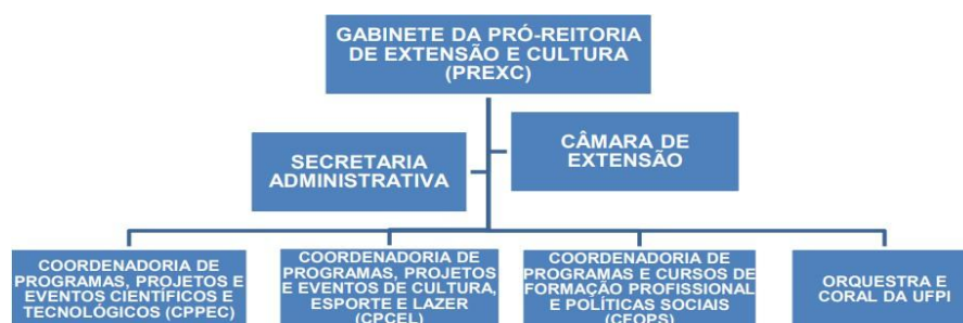
Figura 1: Organograma PREXC.