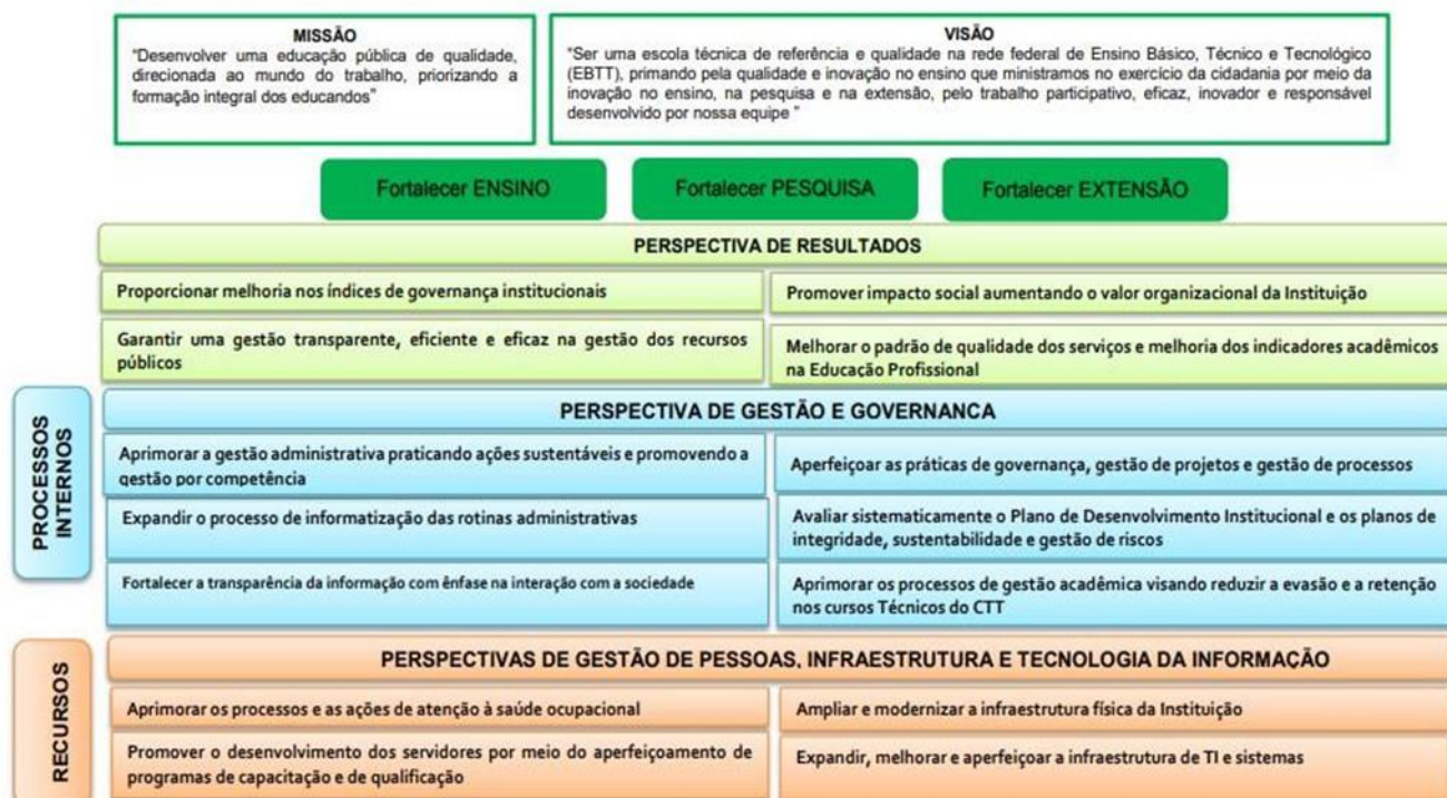
Figura 2 – Mapa estratégico do Colégio Técnico de Teresina