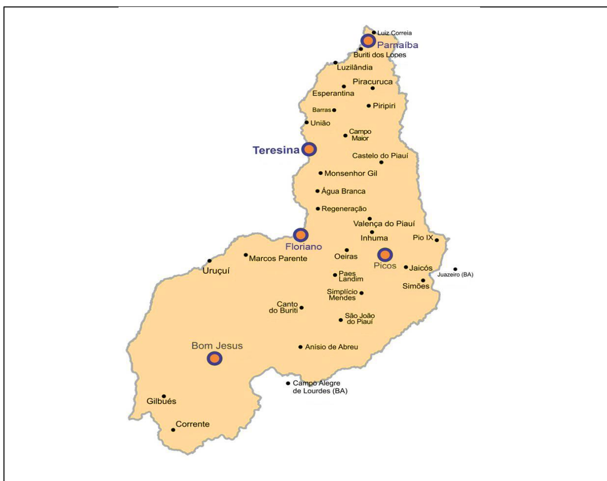
Figura 1 - Mapa do Estado do Piauí, mostrando os municípios onde a UFPI atua, na educação presencial e a distância.

No Campus sede, o CMPP, existem 06 (seis) unidades de ensino convencionalmente denominadas de centros de ensino, que são os Centros de Ciências: da Educação (CCE), da Natureza (CCN), Humanas e Letras (CCHL), Agrárias (CCA), Saúde (CCS) e Tecnologia (CT) e mais um centro diferenciado que congrega os cursos na modalidade EaD: Centro de Educação Aberta e a Distância (CEAD), conforme demonstra a Figura 1.